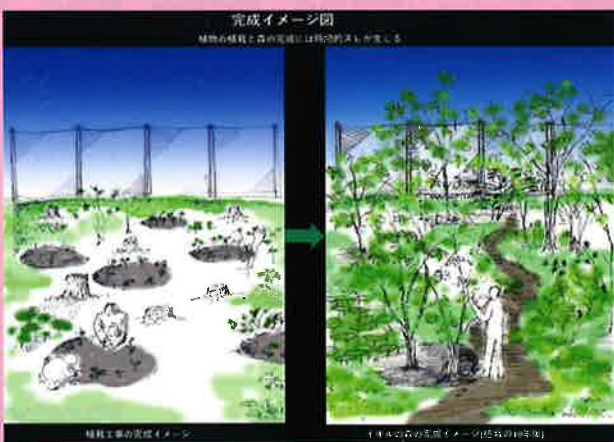
第33回 第一生命賞 札幌アイヌ協会