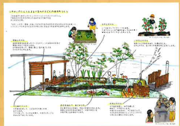
第33回 第一生命財団賞 一般社団法人異才ネットワーク