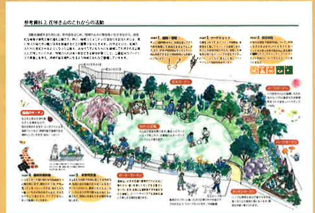
第33回 国土交通大臣賞 花咲き山

日常的な花や緑の活動を通して、地域の活性化や子どもたちへの情操教育、身近な環境の改善に寄与するプランを募集します。